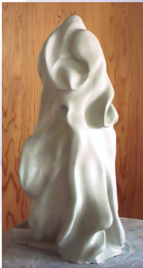
Skytsenglen for livsglæde.

hukommelsen, give slip på oplevelserne og blive i kroppen. Jeg kan nu tilgive mig selv, den, der misbrugte mig,